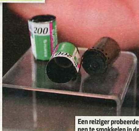
Een reiziger probeerde pijlgifkickers bin- nen te smokkelen in deze filmrolletjes.

'Mensen maken zich soms te weinig zorgen. Ze kopen iets zonder er verder bij na te denken. Veel reizigers zijn nogal naïef'